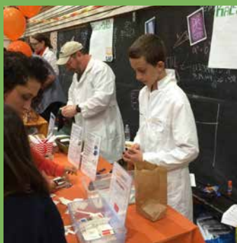
Revisado en agosto, 2021

Para ver los resultados individuales de exámenes de las escuelas y la demografía, visite la página web del Departamento de Educación de California (CDE siglas en inglés) en www.cde.ca.gov . Las Tarjetas de Calificaciones de Responsabilidad Escolar se pueden encontrar en la página web del SMFCSD en www.smfcSD.net .