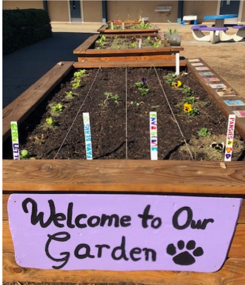
¡El éxito del día de embellecimiento de George Hall en octubre!